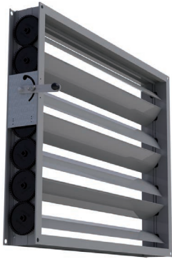
AOBD-102-E handmatige bediening