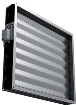
AOBD-102-E bediening d.m.v. motor